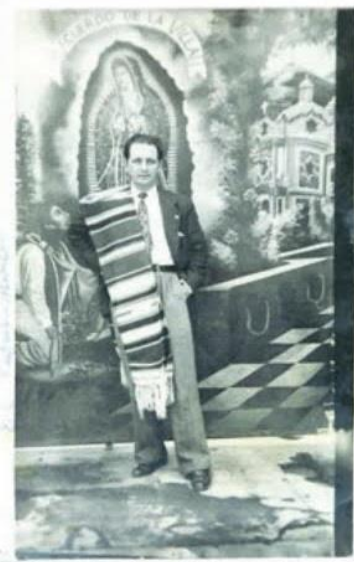
La obra musical de Lara está patentada en el Centro Nacional de Registros (CNR).

EL GRUPO DE JÓVENES ERRANTES CANTAUTORES Y LA ORQUESTA MARÍA DE BARATTA SE UNEN PARA INTERPRETAR LAS CANCIONES DEL FAMOSO COMPOSITOR PANCHO LARA EN UNA FUSIÓN SINFÓNICA Y FULL BAND.