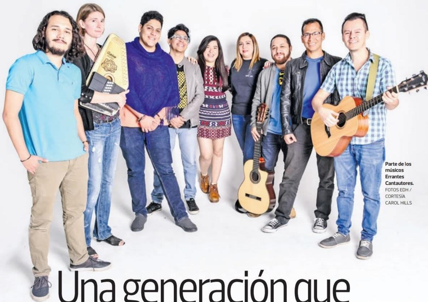
Parte de los músicos Errantes Cantautores.

Una generación que reivindica a Pancho Lara