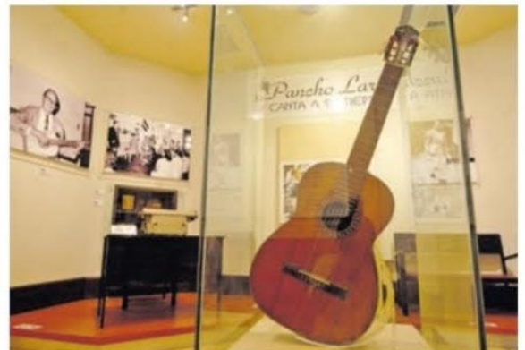
La sala Pancho Lara, en el Museo Universitario de Antropología de la Universidad Tecnológica de El Salvador (Utec).

Para los interesados, las entradas en preventa tienen un precio de $10 y el día del evento $15. Los puntos de venta son Tutto Café (Centro Histórico), La Cafetera (San Benito), Fulanos Café (Escalón), Hecho en Casa (C.C. Galerías) y Librerías Latinoamérica (Metrocentro).