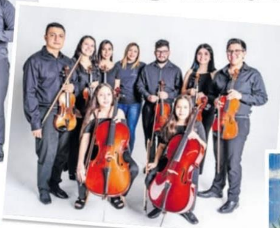
La Orquesta María de Baratta tiene dos años de fundación.